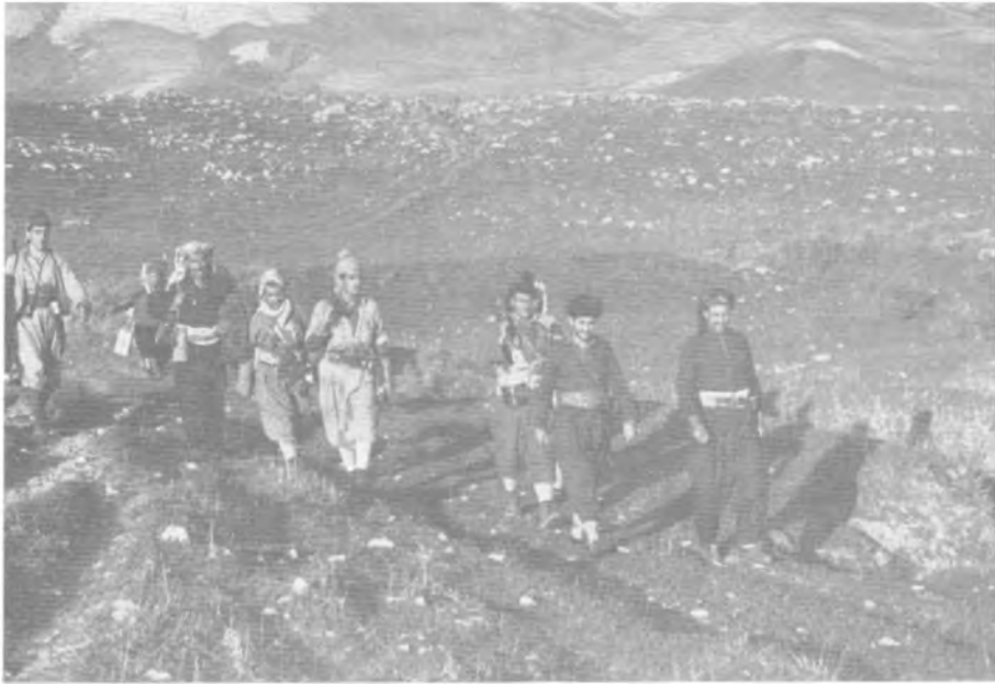
جهوله‌یه‌کی پیشمه‌رگانه، ۱۹۶۳ ماوه‌ت